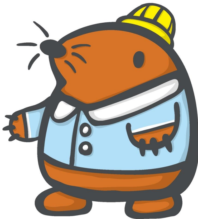
オグラのモグラ オグちゃん